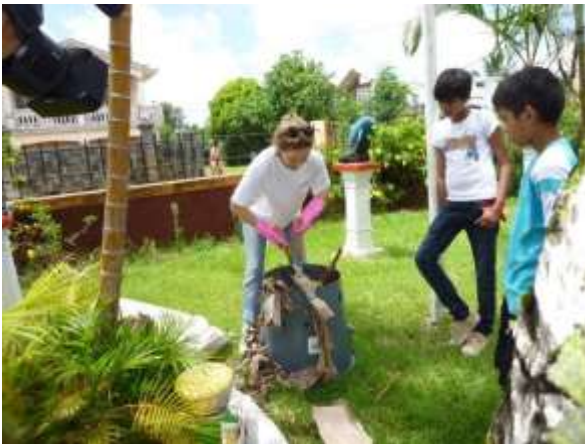
Nadia from Mission Verte making a presentation of how to produce a successful compost