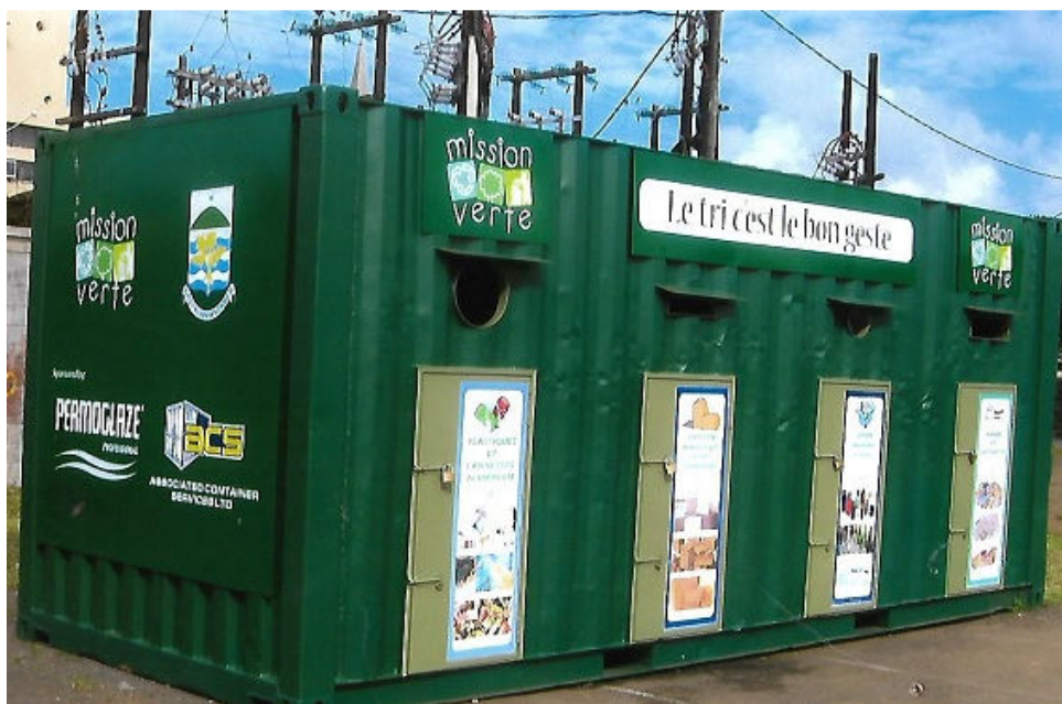
Notre premier conteneur de tri près du bureau du CEB à Curepipe, installé fin 2007

Le 10 août 2007, une certaine association du nom de Mission Verte était enregistrée auprès du Registrar of Associations... 10 ans déjà ! Nous avons accompli un beau parcours depuis les premiers rendez-vous donnés au public qui venait déposer ses déchets recyclables, en passant par l'installation de nos premiers conteneurs de tri, le commencement du programme éducatif, l'acquisition de notre premier van de collectes en 2011, celle du deuxième fin 2014.