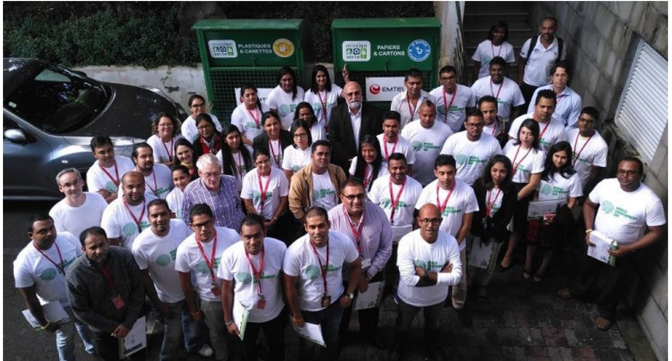
L'inauguration des deux conteneurs de tri à Emtel